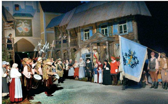
Abmarsch der Landfahne

Dargeboten wird das Schauspiel von der Volksspiel-